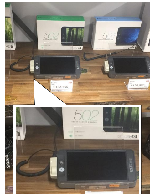
ループ部分を什器に括り、 本体側を商品に設置