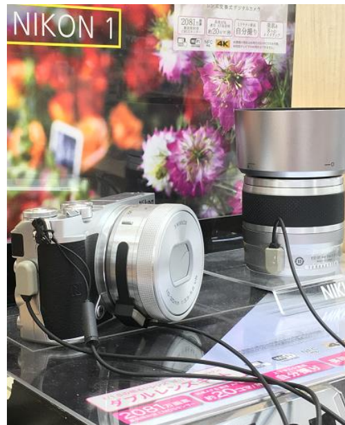
カメラ、レンズ、双眼鏡