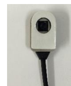
【EXミニタグ用貼替台紙シール】 20枚/1シート