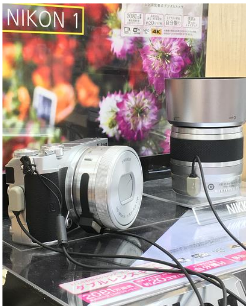
カメラ、レンズ、双眼鏡